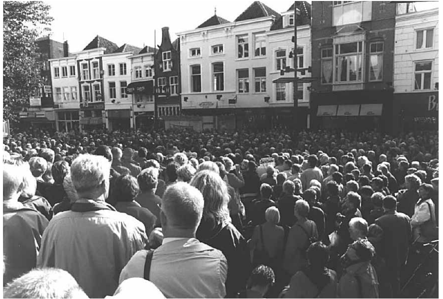
Massaal zingen tijdens het Bossche funfestival in 2000.